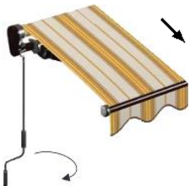
Strana obsluhy zleva

Točením kliky ve směru hodinových ručiček markýza vyjíždí.