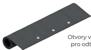
Otvory v potahu pro odtok vody

Konstrukci markýzy tvoří kazeta hranatého tvaru, výpadevový profil a boční vodící kolejnice, ve kterých ozubená řemenice a speciální listové pružiny napínají potah, aby poskytoval optimální ochranu před sluncem. Markýzu lze instalovat na stěnu či do stropu a lze spojit dva moduly a zvýšit tak chráněný prostor. Markýzu lze instalovat na pergoly či zimní zahrady a lze je instalovat vedle sebe jako moduly. Unikátní systém ZIP zajišťuje 100% napnutí potahu ve vodících kolejnicích a zamezuje vzniku technologické mezery mezi potahem a kolejnicemi.