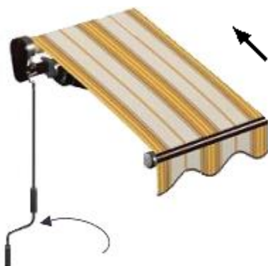
Strana obsluhy zleva

Točením kliky proti směru hodinových ručiček markýza zajíždí.