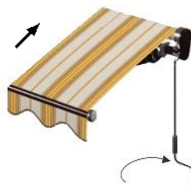
Strana obsluhy zprava

Točením kliky ve směru hodinových ručiček markýza zajíždí.