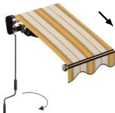
Strana obsluhy zleva

Točením kliky ve směru hodinových ručiček markýza vyjíždí.