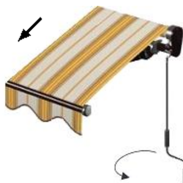
Strana obsluhy zprava

Točením kliky proti směru hodinových ručiček markýza vyjíždí.