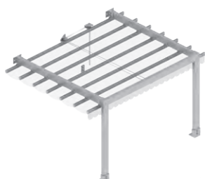
Kotvení zeď - podlaha, ovládání lanovým převodem