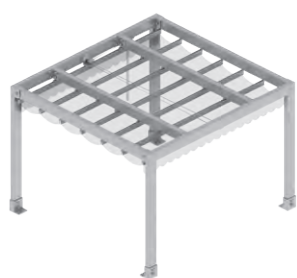
Samostatně stojící, ovládání lanovým převodem