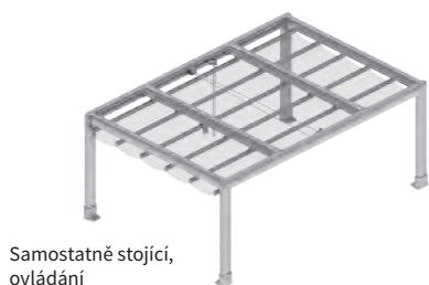
Samostatně stojící, ovládání lanovým převodem