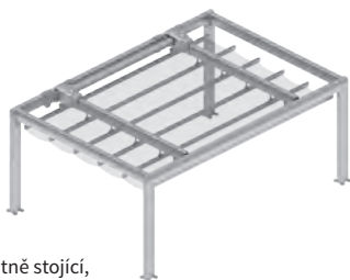
Samostatně stojící, ovládání elektromotorem