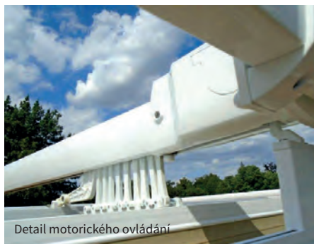
Detail motorického ovládání