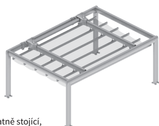
Samostatně stojící, ovládání elektromotorem