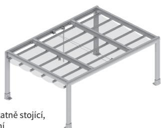
Samostatně stojící, ovládání lanovým převodem