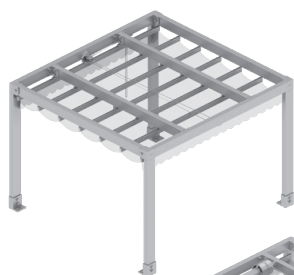
Samostatně stojící, ovládání lanovým převodem