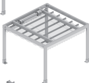
Samostatně stojící, ovládání elektromotorem