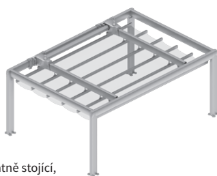
Samostatně stojící, ovládání elektromotorem