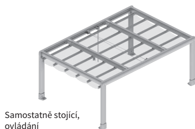
Samostatně stojící, ovládání lanovým převodem